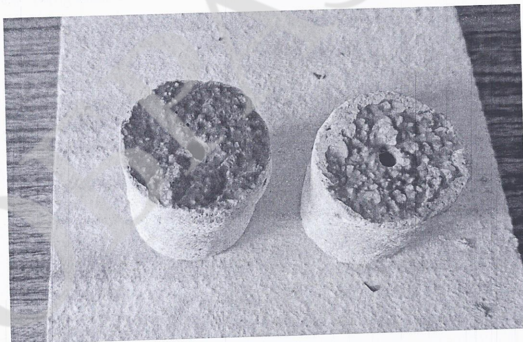
Рисунок 2. Общий вид образца после проведения испытаний